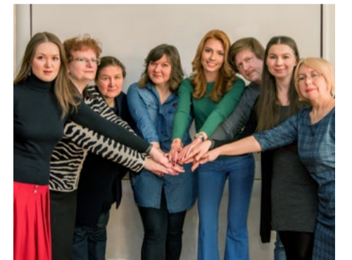
Коллектив редакции корпоративной газеты «Кировец»

На Кировском заводе трудятся 6300 человек, это большая аудитория, и каждый из них должен получать достоверную и оперативную информацию, которую он будет рассказывать друзьям и родным. Нам необходимо правильно формулировать ключевые сообщения для всего мира. Сегодня Кировский завод позиционирует себя как мощное, легендарное предприятие с богатым прошлым и великим будущим. И об этом должны узнать все.